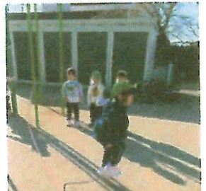
たくたくさん飛べるよ

一年前を振り返ると、泣いて自分の思いを訴えていた子ども達も、少しずつ言葉で伝え、伝わる喜びを感じたことで、友達や先生と色々な話を楽しめるようになってきました。「先生、見て。」と長縄や鉄棒等、出来るようになった事を見せてくれる子や鬼ごっこ等の簡単なルールのある遊びを通して、一人遊びから数人で遊ぶようになってきました。自分のペースで、大きく成長した子ども達の姿を嬉しく、頼もしく感じています。もう少しで年中さんになります。さらなる成長を期待しています。