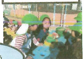
お誕生日おめでとう